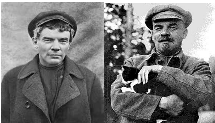
Vladímir Ilich Ulíanov.

La gorra del hombre del primer plano y su largo sobretodo u overol, recuerda mucho a la utilizada por Lenin en innumerables fotografías o grabados que eran de circulación común por aquella época. Intentando – nuevamente- emplear la imagen como evidencia inapelable, por su similitud, no por verosimilitud- con la presencia de marxistas: uno de los suyos estaba ahí. Aquí tienen la foto: es su misma gorra.